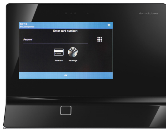
KABA TERMINAL 97 00