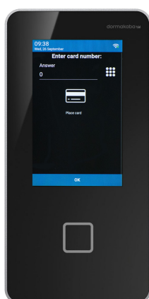
KABA TERMINAL 96 00

Dialogen settes opp i ProMark og reflekterer derfor selskapets eget språk og vilkår. Det kan styres per medarbeiderkategori for optimal datainnsamling.